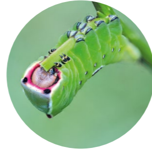
Raupen Goßer Gabelschwanz

... zum Beispiel durch falterfreundliche Pioniergehölze: Weiden an kühlen und frischen Standorten im Wald und an Waldrändern sind für viele unserer Großschmetterlinge besonders attraktiv. Hier bietet das spezielle Kleinklima den Raupen die besten Überlebenschancen.