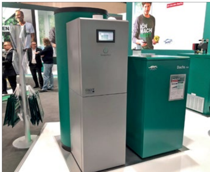
Brennstoffzellen-Mikro-BHKW „Dachs 0.8“ von Senertec

serbereitung an. Viessmann hat mit der „Vitovalor PT2“ ebenfalls eine solche Heizzentrale im Angebot, vermarktet die Panasonic-Brennstoffzelle jedoch inzwischen als „Vitovalor PA2“ auch einzeln als Nachrüstlösung für bestehende Heizanlagen.