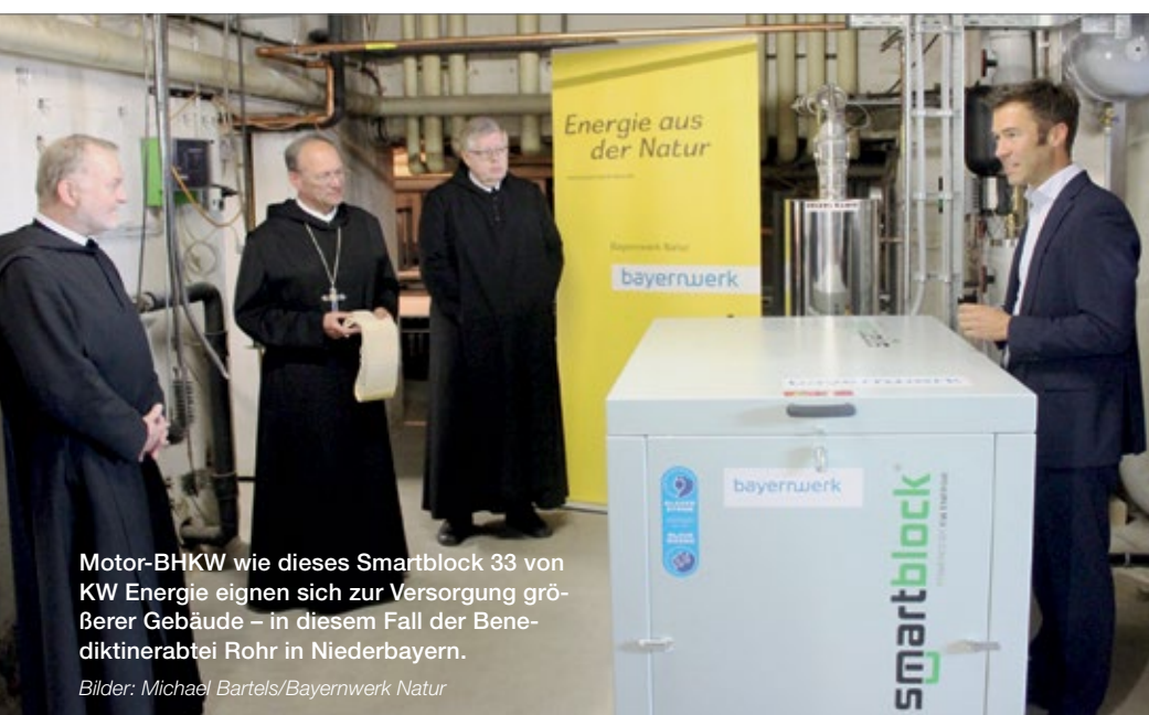
Motor-BHKW wie dieses Smartblock 33 von KW Energie eignen sich zur Versorgung größerer Gebäude – in diesem Fall der Benediktinerabtei Rohr in Niederbayern.

Für Ein- und Zweifamilienhäuser hat sich in den letzten Jahren die Brennstoffzellentechnik als kleinere, leisere und wartungsärmere Alternative zu den klassischen Motor-BHKW durchgesetzt. In Deutschland dominieren zwei Brennstoffzellenhersteller den Markt: SolidPower mit dem Hochtemperatur-Brennstoffzellenmodul „BlueGen“ und Panasonic mit einer Niedertemperatur-Brennstoffzelle, die in Heizsystemen von Viessmann unter dem Namen „Vitovalor“ sowie von Remeha als „eLecta“ und Senertec als „Dachs 0.8“ erhältlich ist. Senertec und Remeha bieten bisher ausschließlich Komplettsysteme bestehend aus Brennstoffzelle, Gas-Brennwerttherme, Pufferspeicher und Warmwas-