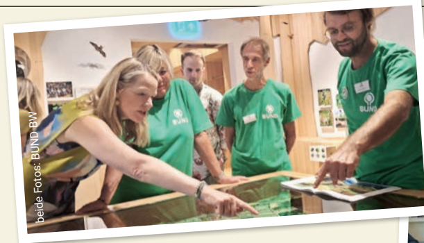
Umweltministerin Thekla Walker (Bild links) und Manuel Hagel (Bild unten Mitte) besuchten das BUND-Naturschutzzentrum.

www.facebook.com/BUNDbawue www.instagram.com/bundbawue www.bund-bawue.de/newsletter