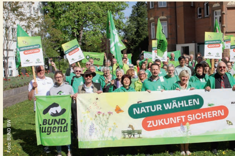
Foto: BUND BW Landesdelegiertenversammlung 2025

Hoffnungsvoll haben wir vor viereinhalb Jahren an dieser Stelle den zweiten grün-schwarzen Koalitionsvertrag kommentiert: »Nach der Wahl ist vor der Novelle. Der Koalitionsvertrag ist ausgehandelt – und er verspricht mehr Klimaschutz.« Tatsächlich gab es hier Bewegung, gute Ansätze und Konzepte.