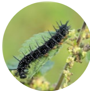
Tagpfauenaugen-Raupe auf Brennnessel