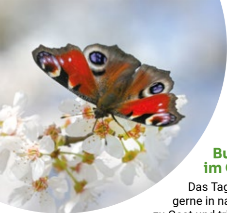
Tagpfauenauge an Kirschlorchblüte