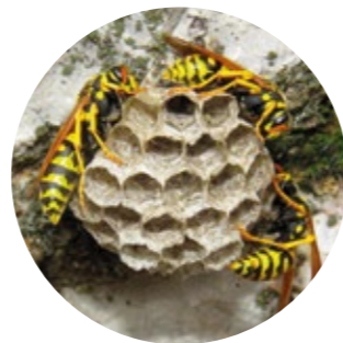
Nest der Haus-Feldwespe