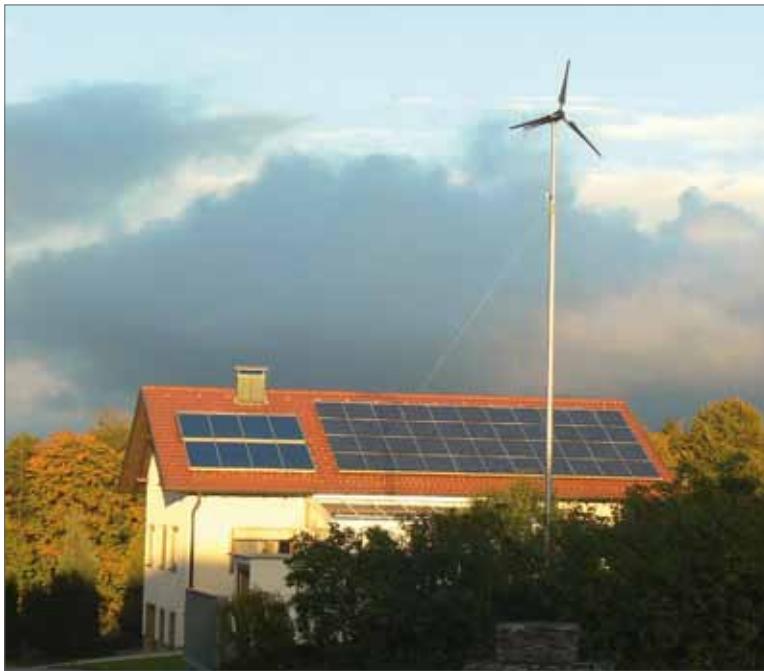
Whisper-100-Anlage (Leistung 900 W) an einem Privathaus in Bubsheim bei Rottweil